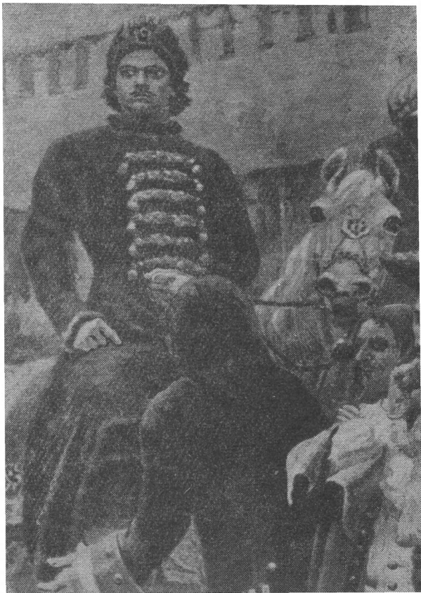
Деталь картины «Утро стрелецкой казни». Петр I на коне.