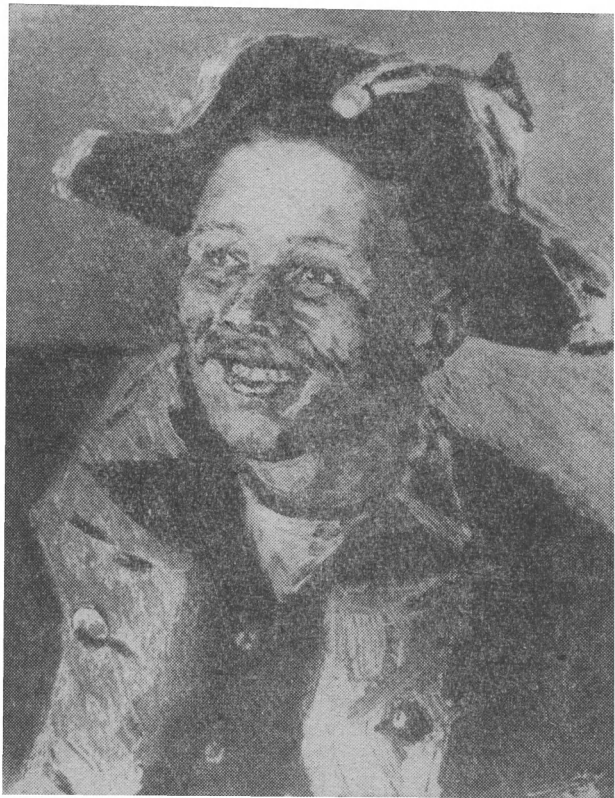
Этюд к картине «Переход Суворова через Альпы». Молодой солдат.