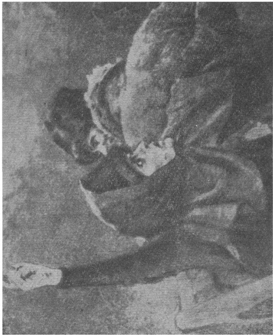
Деталь картины «Боярыня Морозова». Моозова.