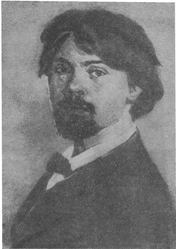
В. И. Суриков. Автопортрет. 1879 г.