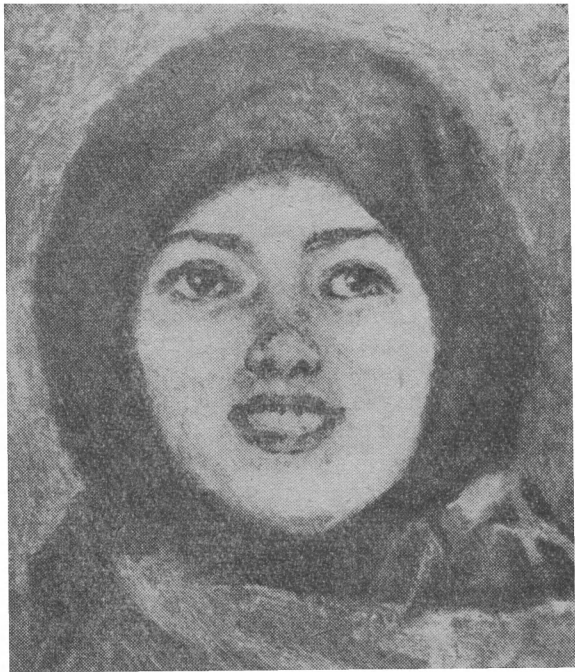
Этюд. Смеющаяся девушка.