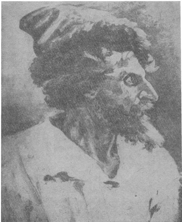
Деталь картины «Утро стрелецкой казни». Стрелец с рыжей бородой.