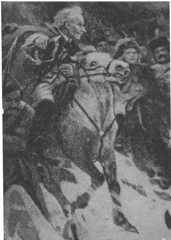
Деталь картины «Переход Суворова через Альпы». Суворов на коне.