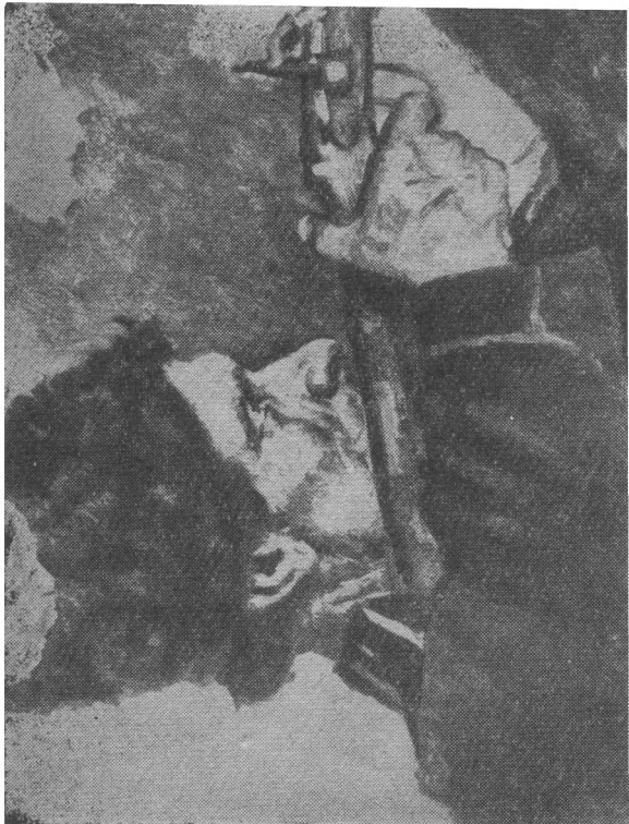
Этюд к картине «Покорение Сибири Ермаком». Стреляющий казак.