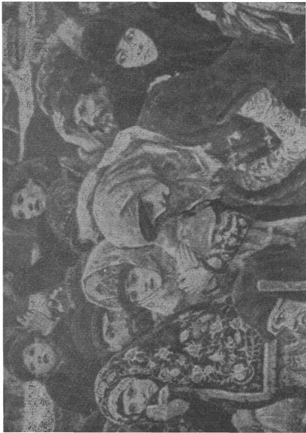
Деталь картины «Боярыня Морозова». Приверженцы Морозовой.