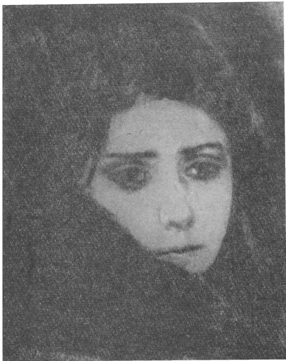
Деталь картины «Меншиков в Березове». Старшая дочь Меншикова.