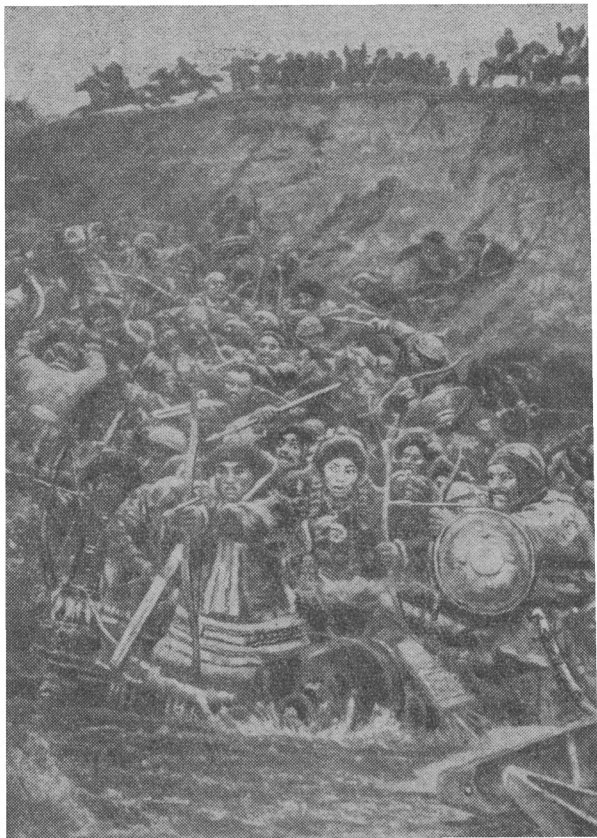
Деталь картины «Покорение Сибири Ермаком». Татарские стрелки.