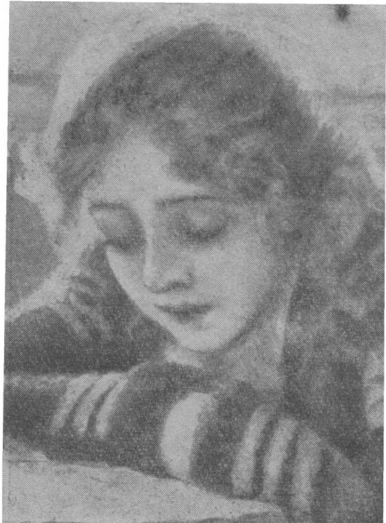
Деталь картины «Меншиков в Березове». Младшая дочь Меншикова.