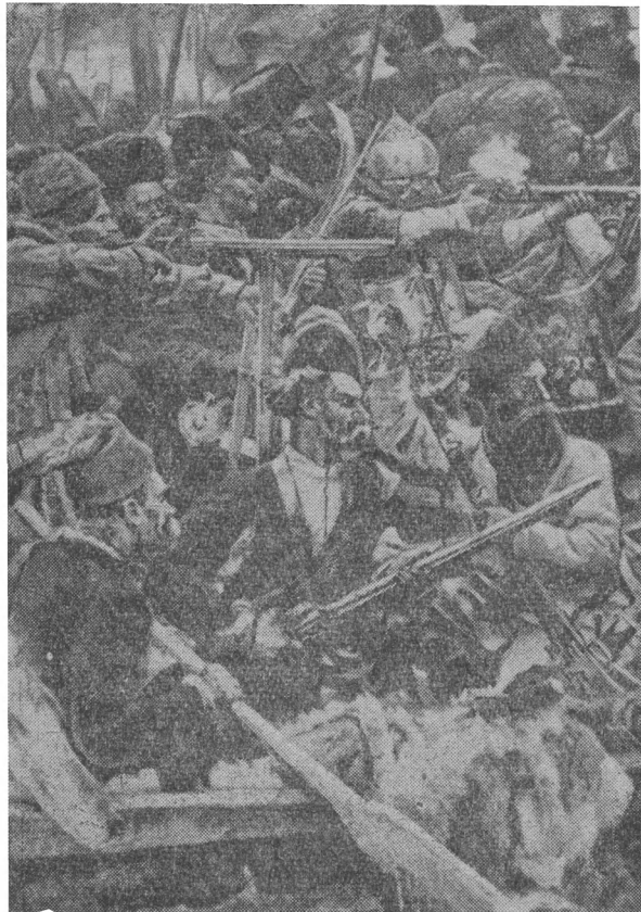
Деталь картины «Покорение Сибири Ермаком». Казачье войско.